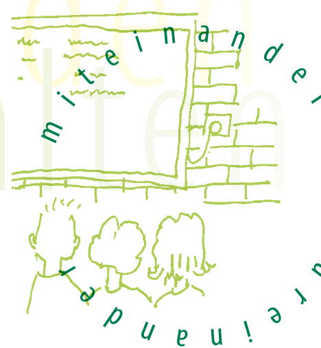
Bildschirme für den Vertretungsplan