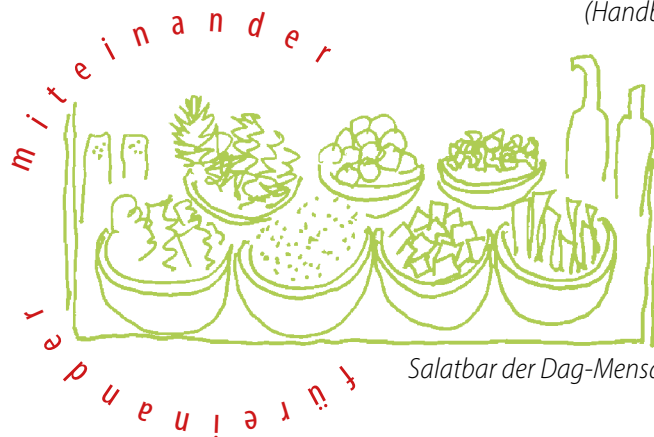
Salatbar der Dag-Mensa