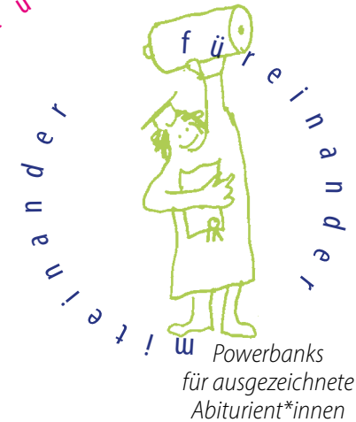
Powerbanks für ausgezeichnete Abiturient*innen